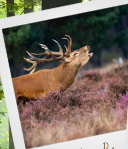
Tips en tricks > P4