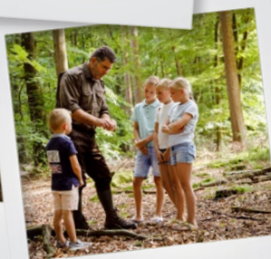
Op wildspeurtocht > P10