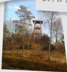
Observatieplekken > P8