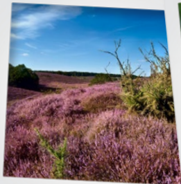
Op de hei