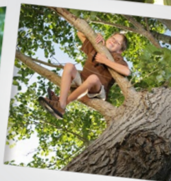
Lekker in de bomen klimmen