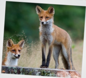
Do's en dont's > P6